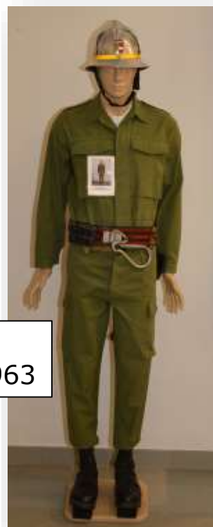
Einsatzanzug Internationale Wettkämpfe Mühlhausen F. 1963