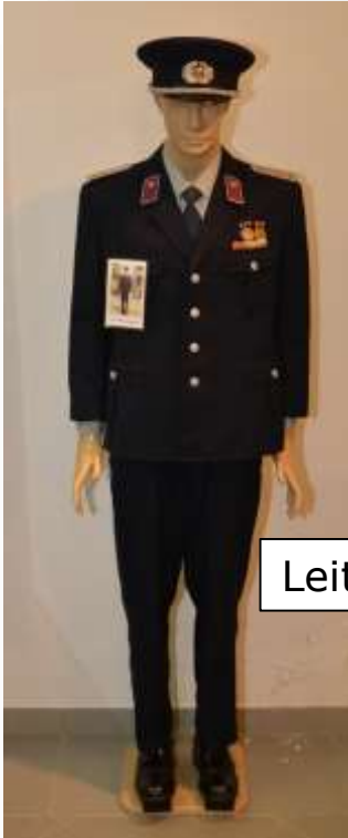
Leitender Dienstgrad ehem. DDR