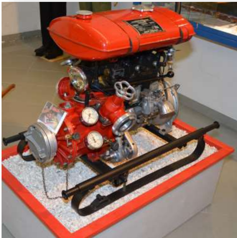
Tragkraftspritze Rosenbauer R60 um 1934