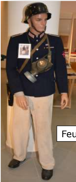
Feuerschutzpolizei 2. Weltkrieg