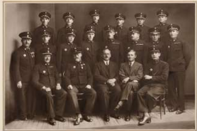
30 jährige Bestandsfeier der Rettungs-Abteilung der Freiwilligen Feuerwehr Hallein