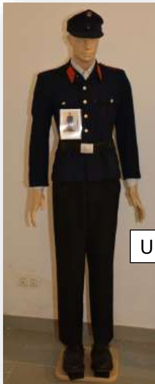
Uniformierung bis 1963-64