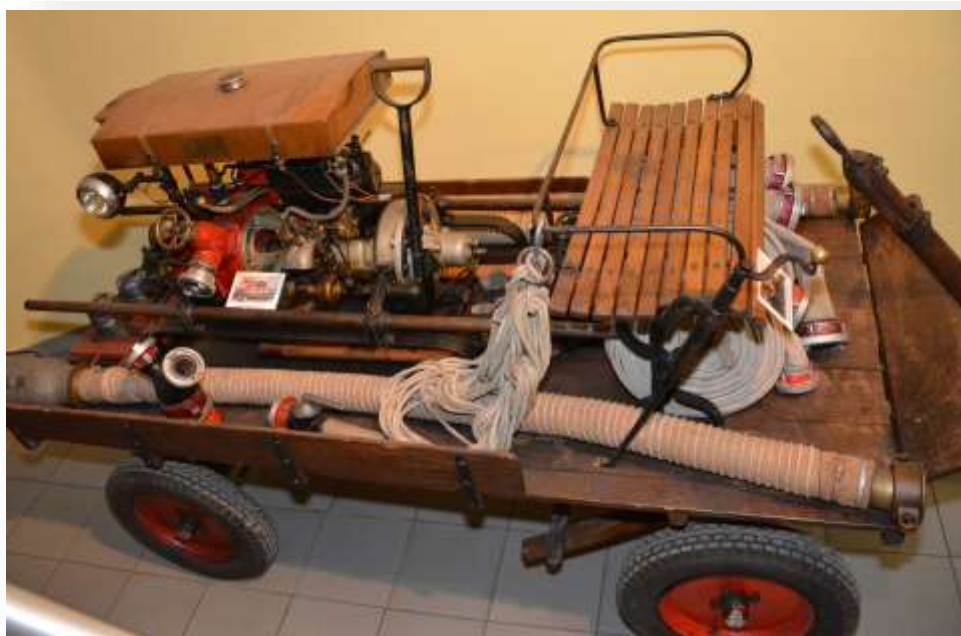
Tragkraftspritze Rosenbauer R50 ca. 1930