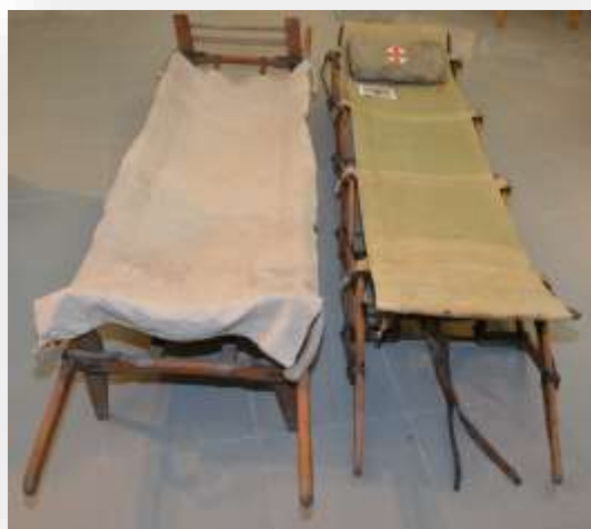
Krankentragen der Rettungsabteilung in der Feuerwehr bis 1945