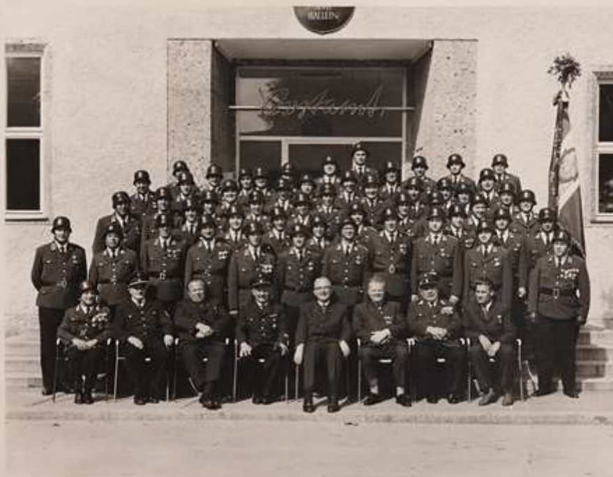
Erinnerung an das 90 jähr. Gründungsfest der Freiwilligen Stadtfeuerwehr am 17. u. 18. September 1960 in Hallein.