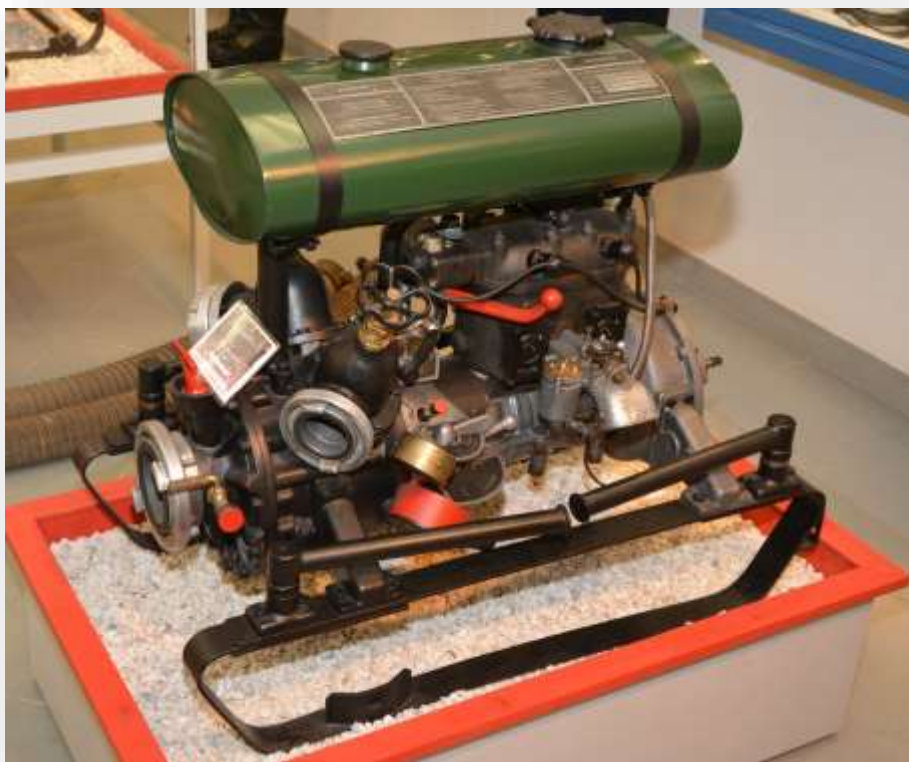
Löschanhänger mit Tragkraftspritze FF Bad Dürrenberg